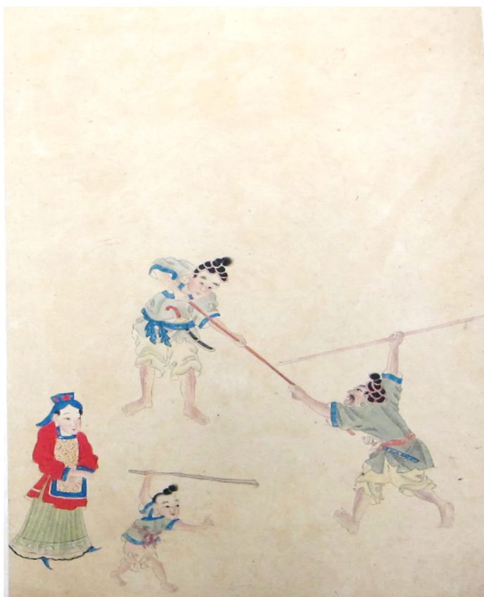
圖3 《滇苗圖說》所繪之麼些