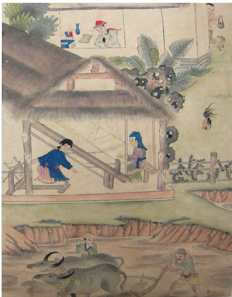
圖 2 《滇苗圖說》所繪之白人